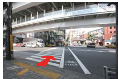
渡り終わったら、 王将側へ横断歩道を直進