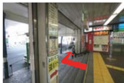
宝くじ売り場を右に見て右折