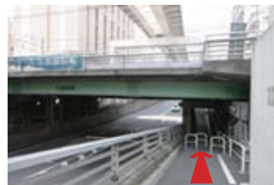
日暮里・舎人ライナー（高架）にそって 片瀬南陸橋をくぐる