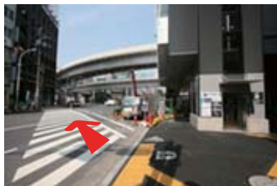
2 02出口を出て、 目の前の横断歩道を直進