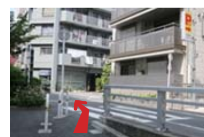
上り終わったら右へ