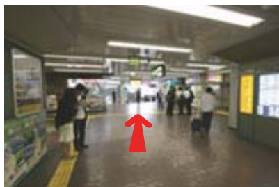
改札を出てキヨスク方面へ直進 (改札は1カ所)