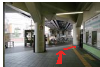
改札口を出て右（改札は1カ所）