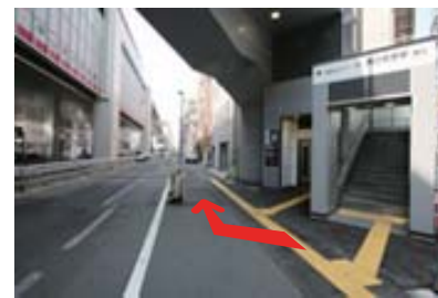
02東口出口を出て、 階段を背にして右手へ直進