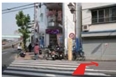
「藍染川西通り」サインポールの角を右