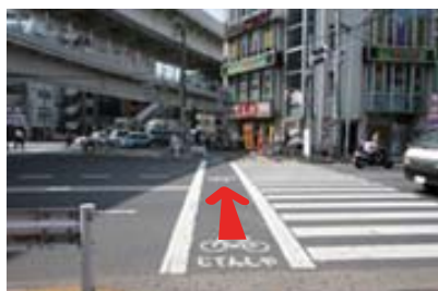
3 03出口を出て、 背後の断歩道を直進