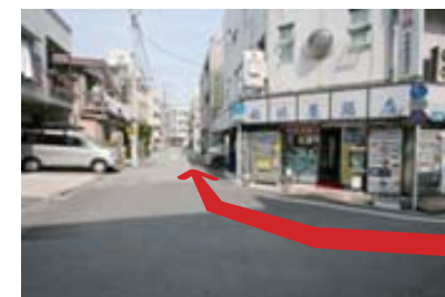
右手「相模原酒店」を右折