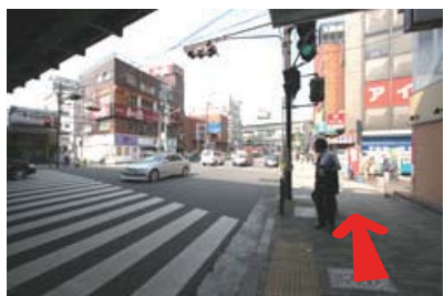
約80m先の 日暮里・舎人ライナー高架まで進む