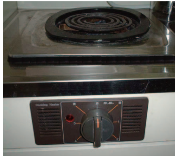
電気こんろ外観例

身体や物が接触し、意図せずスイッチが「入」となる可能性がある構造であったために、電気こんろの上や周囲に可燃物が置かれていて、火災事故に至る危険性があります。