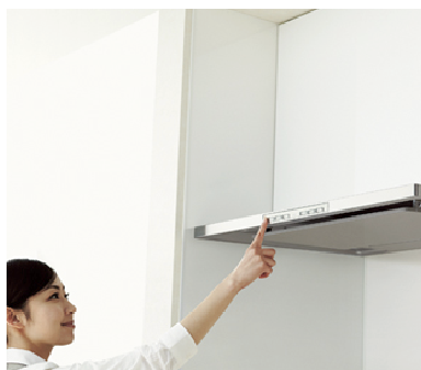
ボタンひとつで自動洗浄

（グッドデザイン賞審査委員の評価コメント 抜粋） 業界初の自動洗浄機能を搭載したレンジフード。全てにおいて省エネルギーに貢献し、デザイン的にも既存のキッチンやリビングにも違和感なくフィットするデザインを実現している。世界へ進出できる製品である。