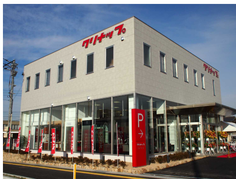
新・徳山ショールーム外観