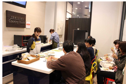
サロナーゼの実演は予約制のプレミアシートイベント

右記より画像がご入手できます： http://cleanup.jp/press/