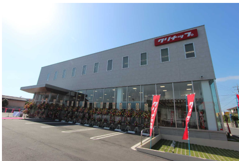
新・鹿児島ショールーム外観