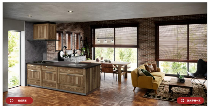
カラーシミュレーション例