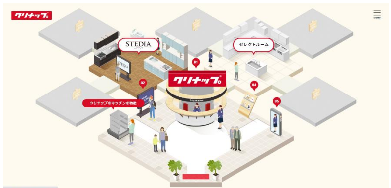
エントランス画面

クリナップのものづくりの理念や商品特長、ユーザーボイスなどの幅広い情報コンテンツを配した「エントランス」と、商品紹介ルーム「STEDIA」、ビルトイン機器を選ぶ「セレクトルーム」のコンテンツをオープン。