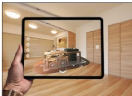
新生活提案キッチン 「HIROMA」をARで体感!

(注意) 新型コロナ感染拡大防止対策: マスク着用、消毒液設置のほか、入場人数制限があります。 尚、飲料は、紙パックでの提供となります。