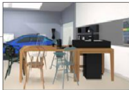
#ガレージキッチンとしてのHIROMA も見どころ! Supported by ニボル・オートモビルズ