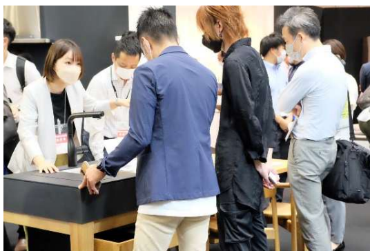
注目を集めた昨年の出展の様子