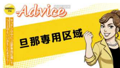
③ アドバイスしているシーン

「はじまりリフォーム」ではアニメを交えてリフォームのお悩みと解決方法を動画で紹介していきます。