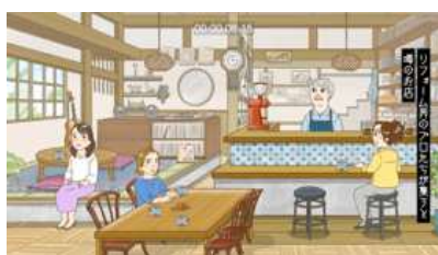
① カフェの世界観・雰囲気