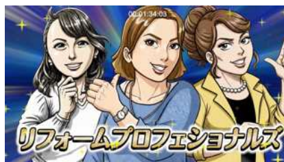
② 専門家の先生をアニメーション化