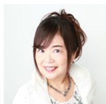
空間・生活設計のプロ