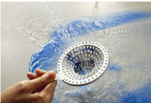
清掃性を向上させる「クリンヘアキャッチャー」

キッチンから笑顔をつくるクリナップがお届けする、システムバスルーム『アクリアバス』。3月1日より受注開始いたします。