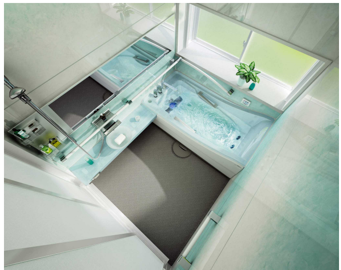
アクリストンクオーツを採用し「デザイン性」を向上