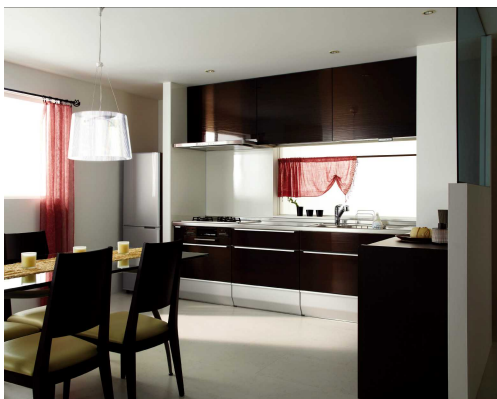
インテリアに馴染むステンレス扉

キッチンをもっと清潔に。もっと便利に。クリナップから笑顔をお届けします。 ぜひ、ホームページをご覧ください（→ http://cleanup.jp/kitchen/cleanlady ）