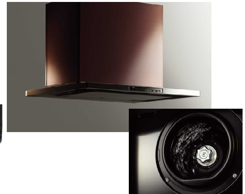
洗エールレンジフード