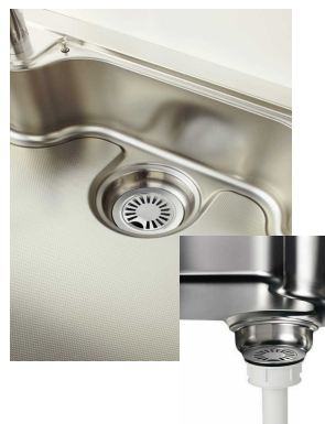
とってもクリン排水口