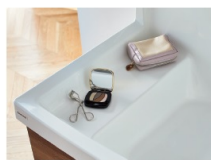
A 身支度、洗濯するたびにドライゾーンで濡らしたくないメイク用品やタオルの一時置きに便利です。