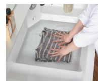
C 排水量が大きいボール、水がたまりにくいため、水を気にせずに大きな衣類もしっかり洗えます。