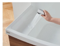
B ハイサイド形状でお手入れも簡単、汚れてもさっと洗い流せます。