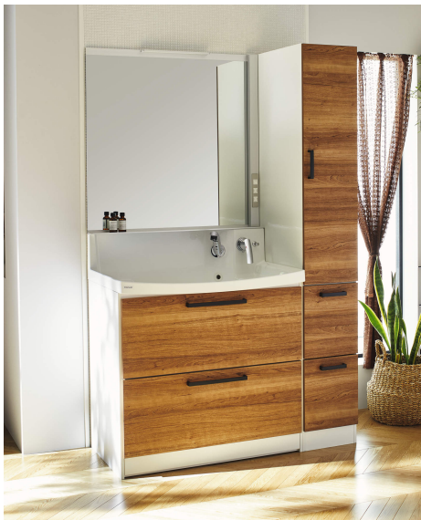
洗面化粧台「ファンシオ」（間口90cm）セット例

また、この「ファンシオ」を筆頭に、「ティアリス」「S—エス」シリーズの意匠性の強化。それぞれ、扉色を刷新し、キッチンでも好評のブラック色の取手も選択可能となりました。