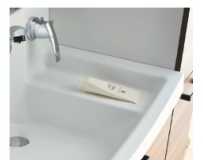
D よく使うハンドソープやスポンジなどを洗いながら、同時に洗い流すことができます。