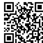
【キャンペーンサイト】