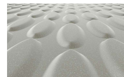
「足ピタフロア」拡大写真(左)

「足ピタフロア」は水切れが良く乾きやすいので、入浴後や掃除後の、から拭きの手間を省けます。また凸部の形状が楕円で表面がなめらかなため、スポンジが溝まで届き、石鹸カスなどの汚れが残りにくいのも特長です。