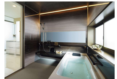
システムバスルーム「アクリアバス」

※参照：「健康・快適居住環境の指針—健康を支える快適な住まいを目指して—」（東京都福祉保健局 平成29年3月発行）