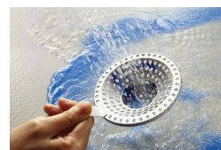
取手を持ってサッと処理できる「クリンヘアキャッチャー」(左) 手が届きにくい場所もキレイに保てる「ステンレス天井」(右)

ステンレスシステムキッチンを手掛けるクリナップならではのアイテムも用意。美コート（親水性のセラミック系特殊コーティング）を施した「ヘアキャッチャー」は、汚れを浮かして、水アカや皮脂の汚れもしっかり落とせます。オプションの「ステンレス天井」を追加すれば、カビが根を張りにくいので、高く手が届きにくい天井も清潔に保つことができます。