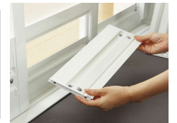
漂白剤を使用せずに汚れを落とせる「クリンパッキン」(左) 簡単に取り外して、丸洗いができる「お手入れ簡単ドア」(右)