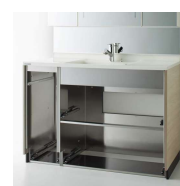
洗面化粧台「TIARIS」、「S」でステンレスキャビネットを採用。

浴室同様に湿気が多い洗面室には、キッチンと同様のステンレスキャビネットを採用した洗面化粧台を用意。木製より湿気に強く、カビが繁殖しにくい仕様です。