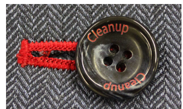
「cleanup」の文字を入れたボタンやブランドカラーのレッドをブラウスの襟元やウエストポーチの縁取りなどに取り入れ、随所にクリナップらしさを表現