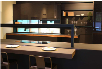
Genius Loci(ジーニアスロッチ)