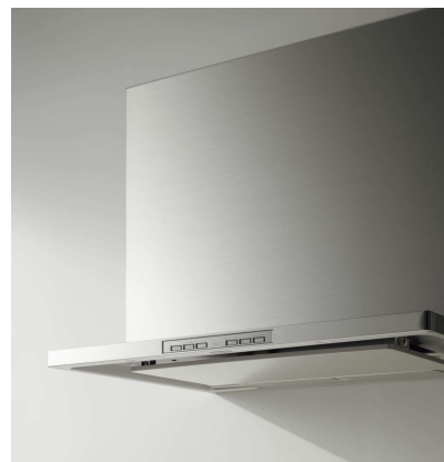
現行の洗エールレンジフード（2013年～）