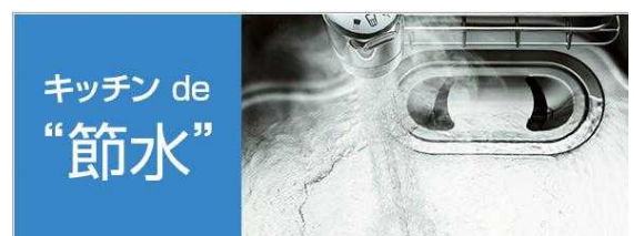
「キッチン de “節水”」Web サイトバナー