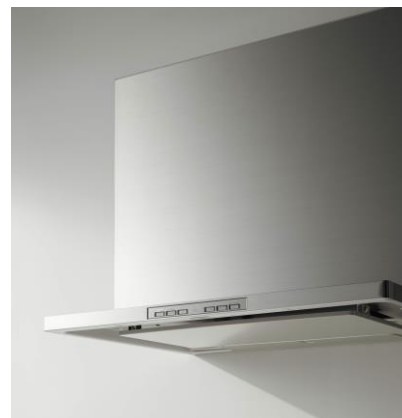
現行の洗エールレンジフード（2013年～）