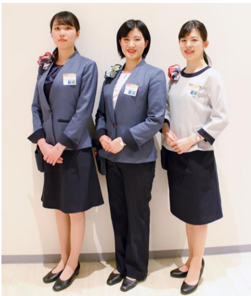
スカートとジャケットを組合せたワンピース風スタイル（左）シルバーのブラウスとパンツ、ジャケットを組合せたスタイル（中）爽やかな夏用のブラウスとスカートのスタイル（右）

全国のショールームにおいて、気品と清潔感溢れる新制服で、これまで以上に、お客様へ「心豊かな食・住文化」をご提案できるよう、努めてまいります。