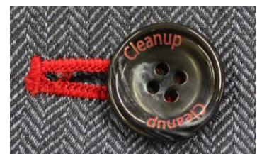
「Cleanup」の文字を入れたボタンやブランドカラーのレッドをブラウスの襟元やウエストポーチの縁取りなどに取り入れ、随所にクリナップらしさを表現