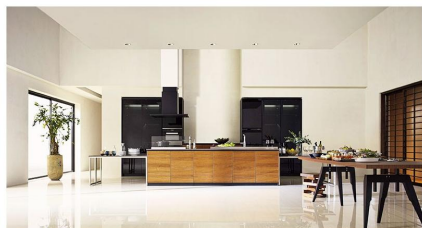
新コンテンツ「プロのキッチン」トップ

プロとして活躍している会員様のキッチンには、使いやすく居心地の良いキッチンへのこだわりがたっぷり。ここでは、クリナップのキッチンを実際に教室でお使いいただいている皆様の生の声をご紹介します。「プロはキッチンのどんなところを見ているのだろう」、「プロのこだわり・工夫を盛り込んだキッチンを見てみたい」、「キッチンのプロのアドバイスがほしい」といった、「プロの視点」にご興味のある方は、ぜひご参考してください。