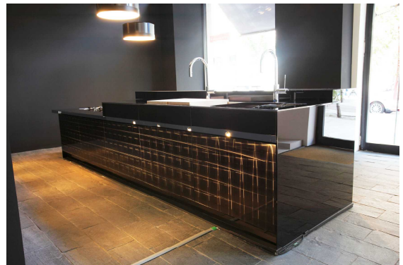
研磨によるデザインが光により浮かび上がるステンレス扉