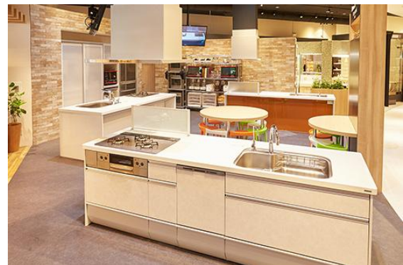
会場: クリナップ・キッチンタウン・東京

右記にて画像がご入手できます: http://cleanup.jp/press/