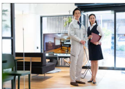
1. 地域密着型、全国約4000店舗 「水まわり工房加盟店」は、独自の加盟基準をクリアしたお店です。地域に密着したお客様にご満足いただける豊富な知識と確かな技術を有し、質の高いサービスをご提供します。