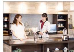
5. 最新の情報の発信 「水まわり工房」は、お客様とクリナップをつなぐ窓口として、多様な情報を提供いたします。